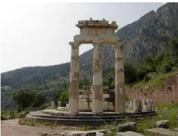
___ORÁCULO DE DELFOS___