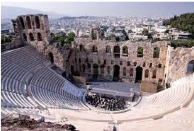
___TEATRO DE ATENAS___